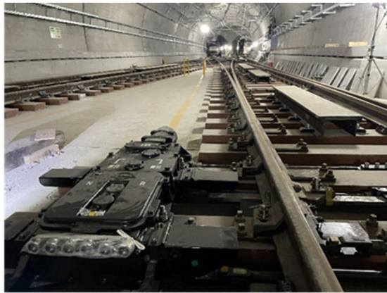
②電線路工事の進捗状況 (トンネル部：櫛田神社前駅～博多駅間)