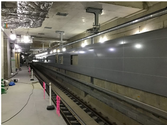
⑤建築・設備工事の進捗状況 （地下駅舎部：プラットホーム）