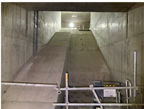
③土木工事の進捗状況 (地下駅舎部：空港線地下1階連絡通路階段)