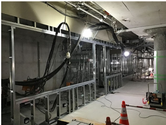
③建築・設備工事の進捗状況 （地下駅舎部：コンコース）