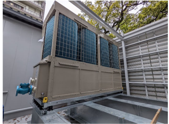
②設備工事の進捗状況 （地上部：出入口上屋への空調室外機設置）