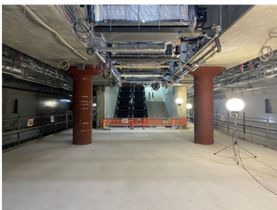
⑤建築・設備工事の進捗状況 (地下駅舎部：プラットホーム)