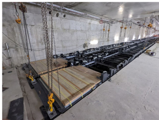
④建築・設備工事の進捗状況 (地下駅舎部：乗換通路の動く歩道設置)