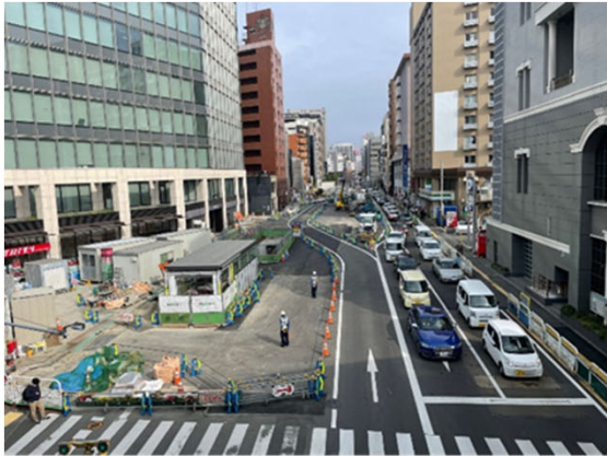
①はかた駅前通りの占用状況 （地上部：祇園町西交差点より）